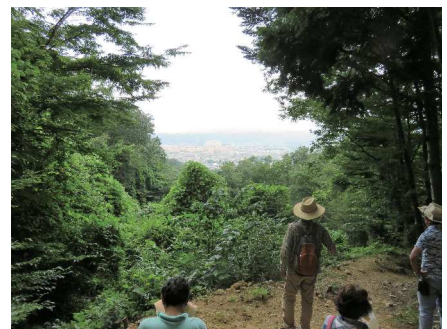
勝峰山での視察風景

【編集後記】 協会事務局のある観光案内所の前が、話題のスマホゲーム「ポケモンGo」のポケストップとなっていました。町内でレアポケモンが出現しないかと日夜搜索中です。マナーを守って遊びながら、ぜひ、日の出町にポケモンをゲットしに来てください。レアポケモンが出現しましたらお知らせくださいね。お待ちしております(M)