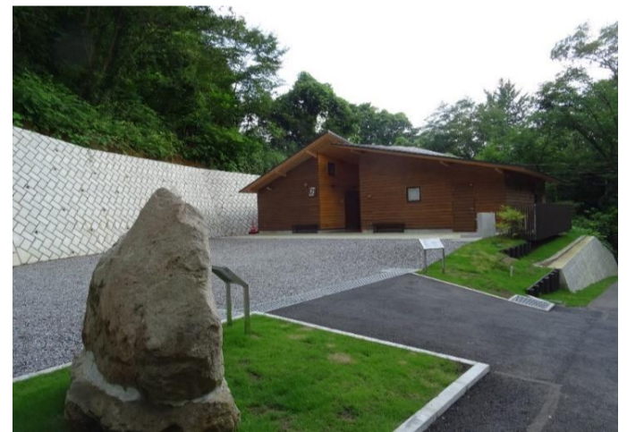
（ひので野鳥の森自然公園管理棟）