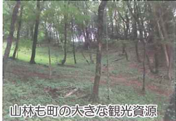
山林も町の大きな観光資源

活動の趣旨に賛同でき、名義の使用によって活動を支援できるもの。 金銭的な支援は伴いません