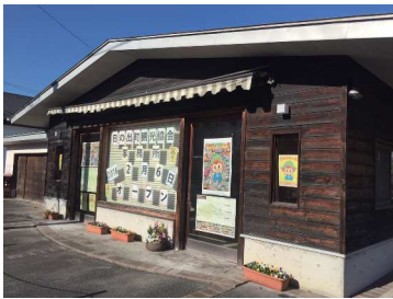
▲オープン間近の新事務所

会場では、餅つき大会(無料配布)のほか、美味しいササミから揚げなどの模擬店や、津軽三味線、和太鼓、忍者ショーなどのステージパフォーマンスも行う予定です。また、先着200名様に、限定オリジナルトートバッグをプレゼント。冬の日、ご家族ご友人を連れて是非、遊びに来てください。お待ちしております。