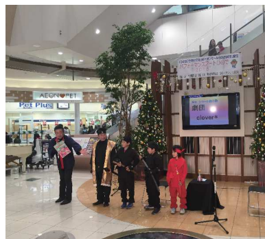
▲来場者に観光PRも行いました