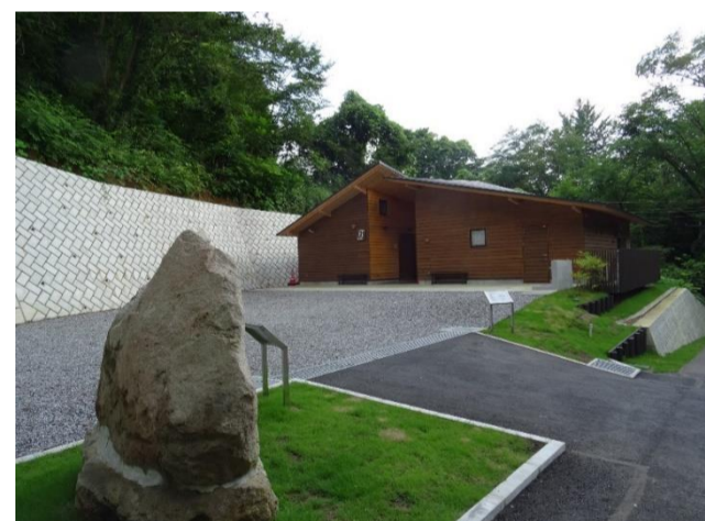
（ひので野鳥の森自然公園管理棟）