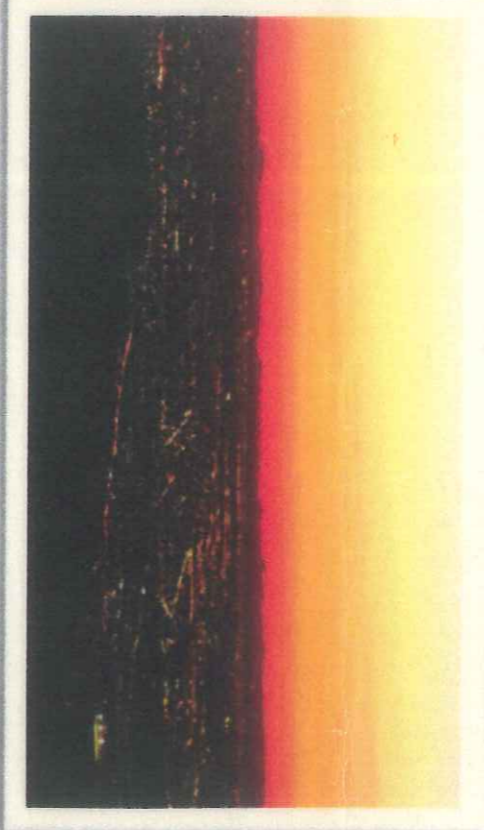
日の出山山頂より 夜明け前