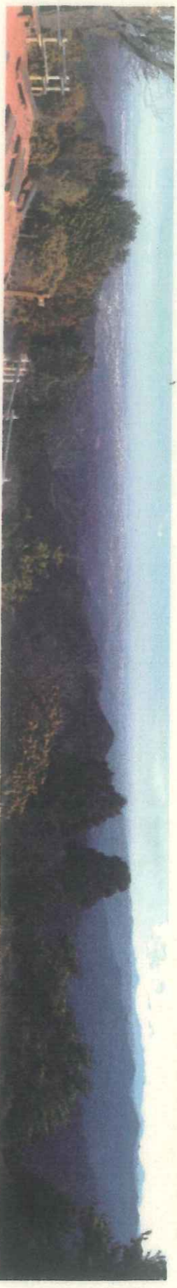
日の出山山頂から東を望む

東雲山荘（東京都日の出町：昭和12年建築）は、都心から49km、都心に一番近い山荘です。