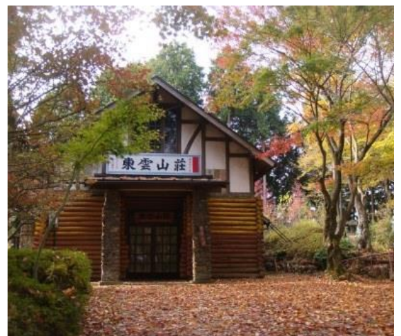
(日の出山山頂直下東雲山荘)