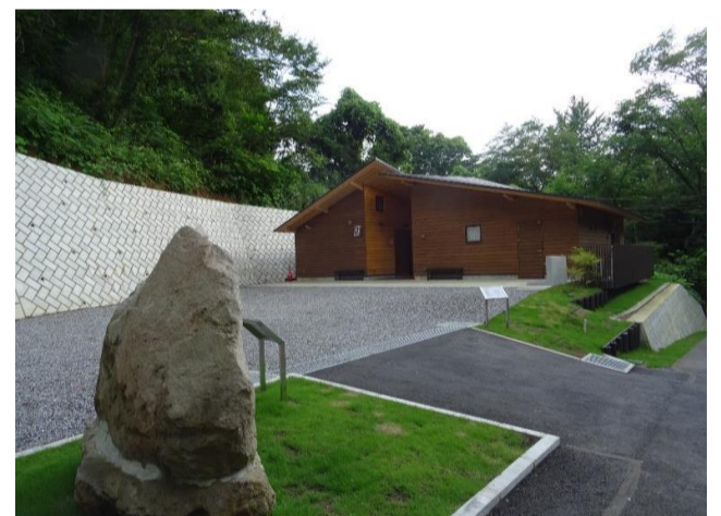
（ひので野鳥の森自然公園管理棟）